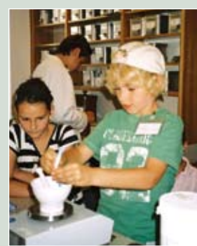
Salben rühren, Tee mischen, Zäpfchen gießen ...